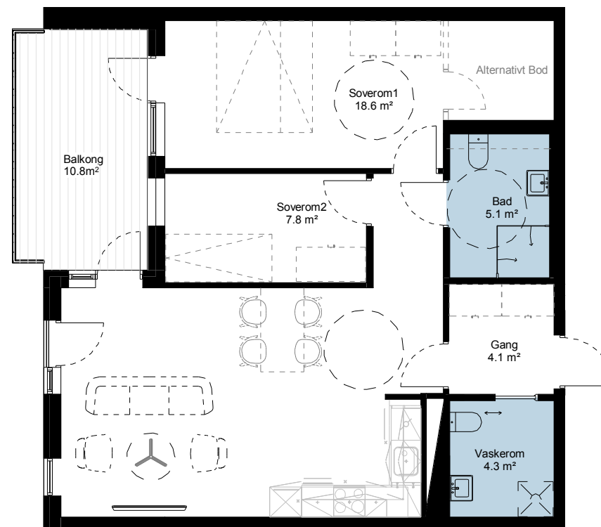
Plan 3 - 4 .etg

Innkassinger for tekniske føringer kan også forekomme i øvrige rom.